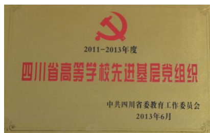
四川省高等学校先进基层党组织