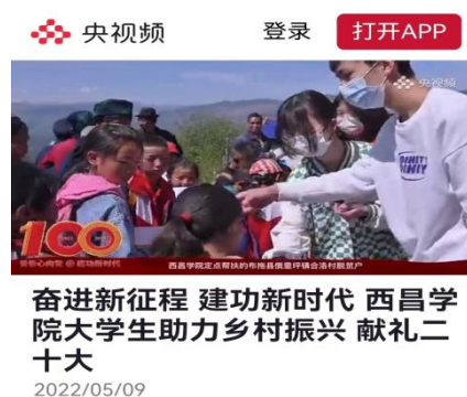
建团100周年前夕，动科学子赴布拖俄里坪镇开展帮扶活动得到央视报道