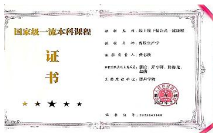
国家一流本科课程证书