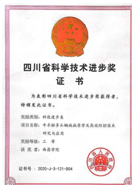
荣获四川省政府科技进步三等奖