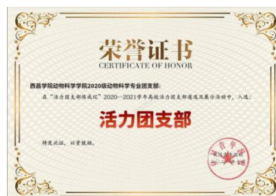
2020级动物科学1班荣获2021年度“全国活力团支部”