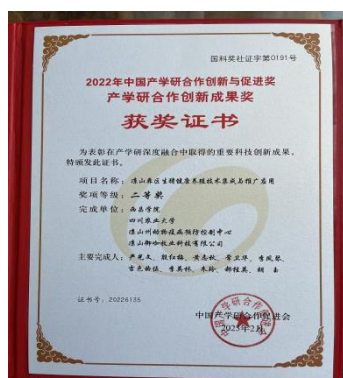
荣获产学研合作创新成果奖二等奖