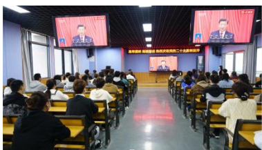
集中收看党的二十大开幕式直播

学院党委始终坚持以习近平新时代中国特色社会主义思想为指引，紧扣立德树人根本任务，围绕区域经济社会发展，秉承“育人本位、社会本位、学生本位”办学理念，凝心聚力推动学院内涵式高质量发展。