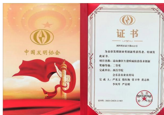
荣获中国发明协会颁发的发明创业奖创新奖二等奖