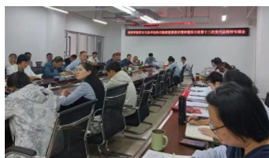
学习习近平总书记来川视察重要讲话精神